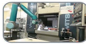
協働ロボットによる 省力化・省人化

当センターでは、ロボット・IoT・AI 技術による省力化や生産性向上の支援を行っています。また、当該技術の活用による高付加価値製品開発の支援も行っておりますので、まずはお気軽にお問い合わせください。