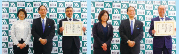
令和3年度の受賞の様子