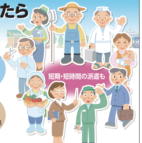
短期・短時間の派遣も