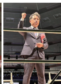
11月26日（水） 27日（木）、第25回商工会青年部全国大会がツカワ未来館アピオ（岩