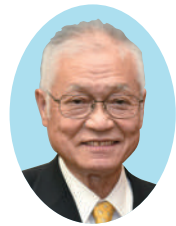
香川県商工会連合会