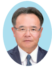
全国商工会連合会